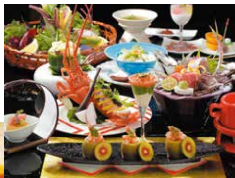
写真上：夕食一例 写真左：朝食一例